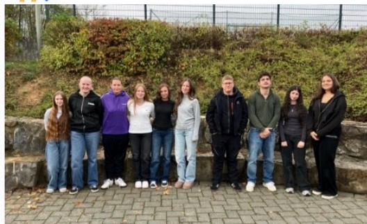
Die aktuellen 10er, welche die Prüfung bestanden haben.