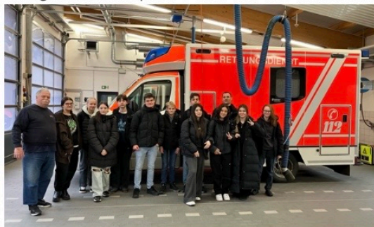
Die 9er beim Besuch in der Rettungswache Barmenohl.